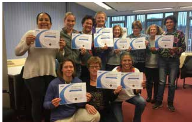
EERSTE UITREIKING DIPLOMA'S CURSUS JOODSE GEBORGENHEID IN DE ZORG

In 2018 is de online hulpverlening via Jouw Omgeving doorgroeid. Ook wordt nu via Jouw Omgeving de online-cursus Joodse identiteit aangeboden aan cliënten en zorgverleners.